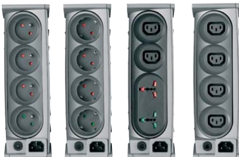
FR DIN UNI IEC